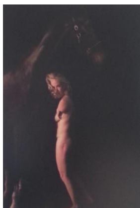
Titel: Film NoBody's Perfekt Technik: Foto, 2013 Format: Höhe: 100 cm, Breite: 75 cm Künstler: Niko von Glasow