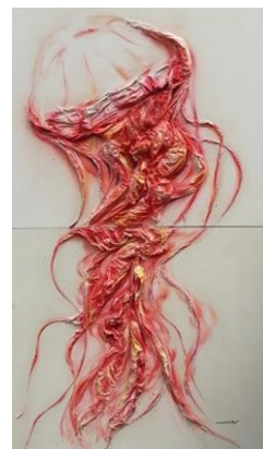
Bild Rechts: Titel: gefährliche Schönheit Technik: Bild auf Leinwand Format (ca.): Höhe: 220 cm, Breite: 200 cm Künstlerinnen: Daria & Sarah Nonn, Anders Art